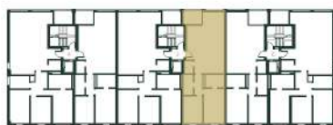
Localização da fracção V