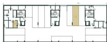
Lugar de Garagem e Arrumo Localização Primeira Cave