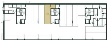
Lugar de Garagem e Arrumo Localização Segunda Cave