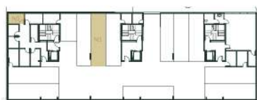
Lugar de Garagem e Arrumo Localização Primeira Cave