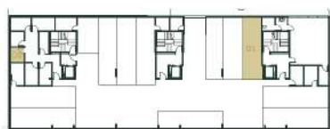
Lugar de Garagem e Arrumo Localização Primeira Cave