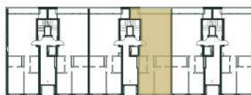
Localização da fracção D