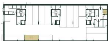
Lugar de Garagem e Arrumo Localização Segunda Cave