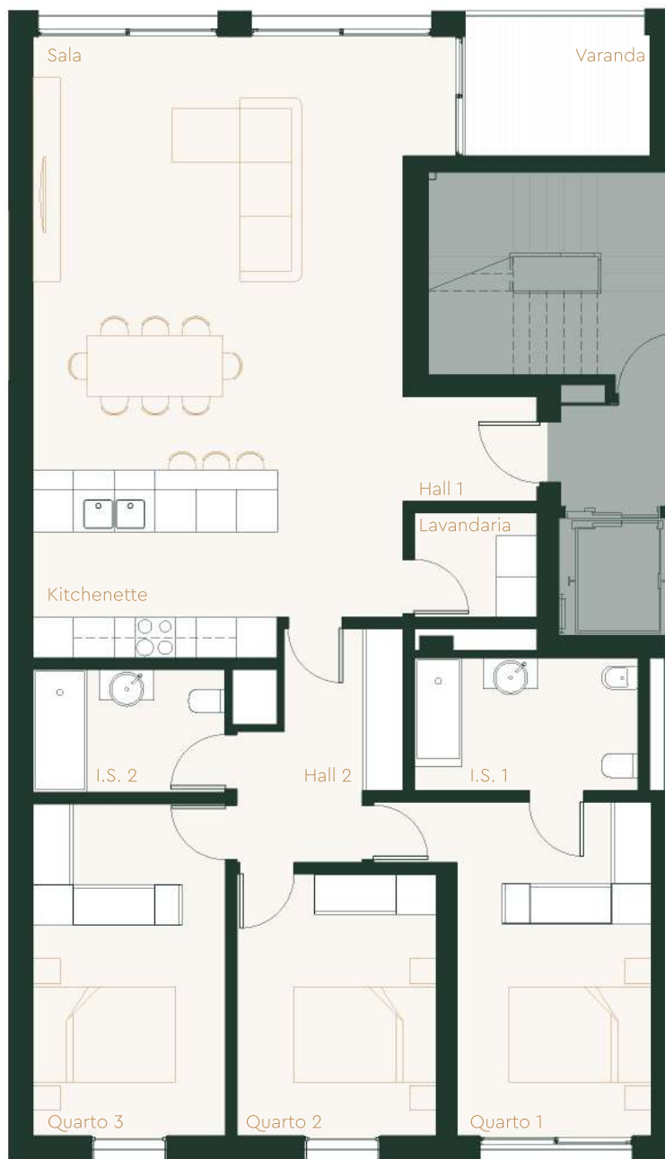
Planta da Fracção U . Escala 1:100