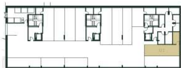
Lugar de Garagem e Arrumo Localização Segunda Cave