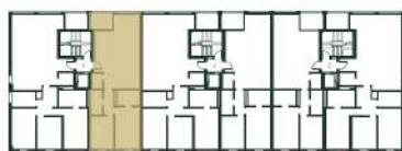
Localização da fracção T