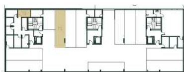
Lugar de Garagem e Arrumo Localização Primeira Cave